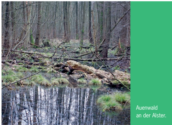
Auenwald an der Alster.