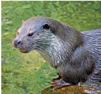
Der Fischotter: Heimlicher Bewohner unserer Gewässer.

Der Fischotter steht im Mittelpunkt der Rallye. Er benötigt großräumige und durchwanderbare Lebensräume, wie naturnahe Fließgewässer oder Seen. Auch an der Alster ist diese sehr seltene Tierart wieder gesichtet worden. Weitere Informationen: www.otterzentrum.de .